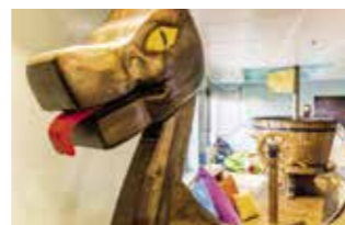
INSEL DER SEERÄUBER – KIDS-CLUB (Deck 14 – Horizont) Der Kids-Club ist Treffpunkt für alle kleinen Superhelden an Bord.