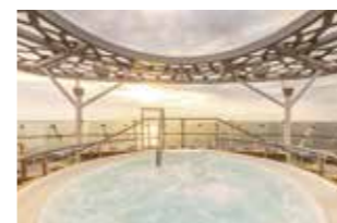
X-SONNENDECK (Deck 15 – Brise) Abschalten und Genießen in besonderem Ambiente für Gäste unserer Suiten und Junior Suiten: Erfrischung inklusive. Als besonderes Highlight können Sie hier ein Bad im Whirlpool genießen.