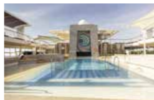
LAGUNE (Deck 12 – Aqua) Einfach mal treiben lassen und im kühlen Nass erfrischen.