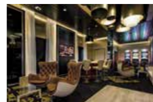
CASINO & LOUNGE (Deck 5 – Pier) Hier liegt ein wenig Monte Carlo in der Luft. Versuchen Sie in stilvoller Casino-atmosphäre Ihr Glück. Wir drücken Ihnen die Daumen.